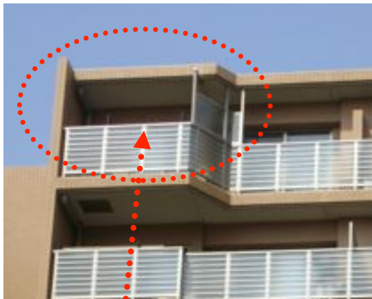
この部屋の天井が漏水した